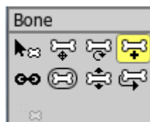
Add Bone eszköz

Adjon, csontokat a Frank-hoz, az Add Bone eszköz kiválasztásával, és kattintson, és húzza felfelé az alábbiak szerint: